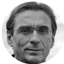
Roland Ries Prefeito de Estrasburgo Presidente da UCLG Comunidade de Prática de Mobilidade