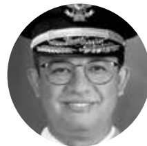
Anies Baswedan Governador de Jakarta Presidente da UCLG Comunidade de Prática de Mobilidade